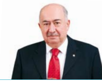
M. Tinas Titiz Yönetim Kurulu Başkan Vekili (Bağımsız Üye)

Yönetim Kurulu'nda Görevde Bulunduğu Süre: 3 yıl